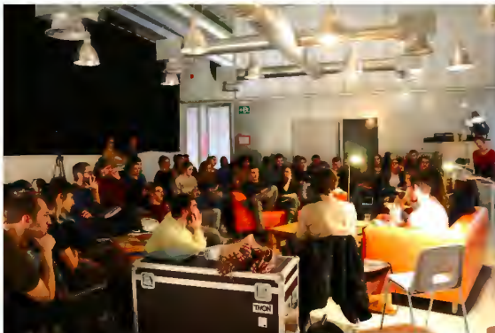
Jornada Dramaturgia Gener 2018

La particularitat que suposa que La Central del Circ sigui gestionada per l'Associació de Professionals de Circ de Catalunya és un valor afegit inestimable, que fomenta el talent i la creativitat des d'un punt de vista sectorial i global, estimulant les sinèrgies amb els altres àmbits del procés artístic. D'aquesta manera, l'APCC dota al projecte de continguts que van més enllà de la pròpia activitat del centre, enriquant la seva oferta i elevant el seu àmbit d'acció més enllà del de la creació artística.