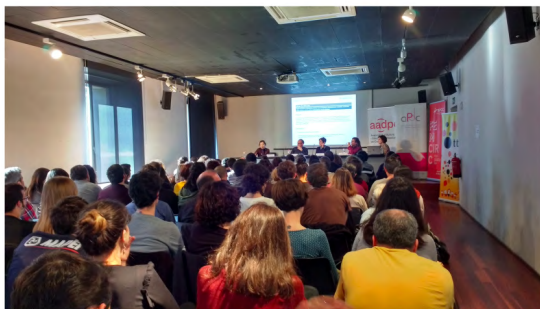
Subvencions a Santa Mònica Febrer 2018

La intenció va ser la d'informar de les subvencions existents per part de les diferents administracions (INAEM Diputació, IRL, ICEC, OSIC, ICUB, Programa.cat). Ponents