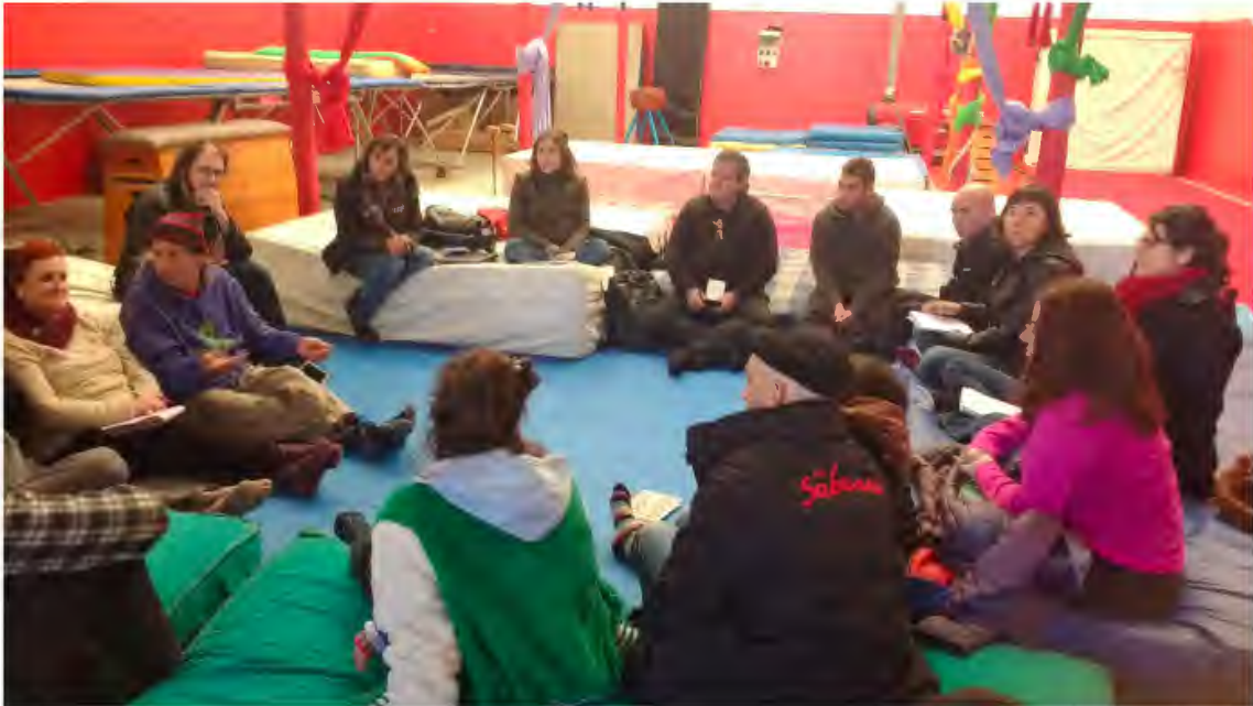
Reunió de la XECC a Espai Circ Los a 2018

Parc del Fòrum de Barcelona Moll de la Vela, 2 08930 Sant Adrià del Besòs (Barcelona) Telf. (+34) 93 356 09 31 info@apcc.cat www.apcc.cat