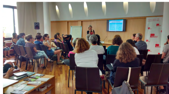
Formules Jurídiques a l'SGAE-Juny 2018