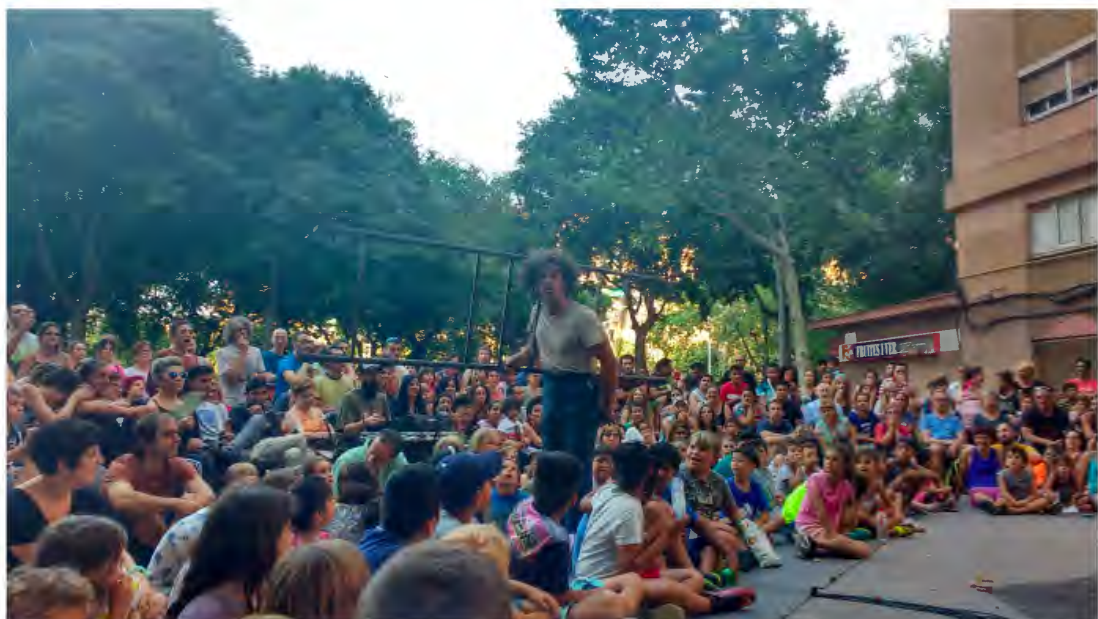
Hotel locandi a Sant Martí de Circ 2018

Despres de dues edicions exitoses aquest any continuareme amb l'objectiu de consolidació, fent-nos costat el programa l'Estiu al Barri, organitzat pel Pla de Barris i el Districte de Sant Martí