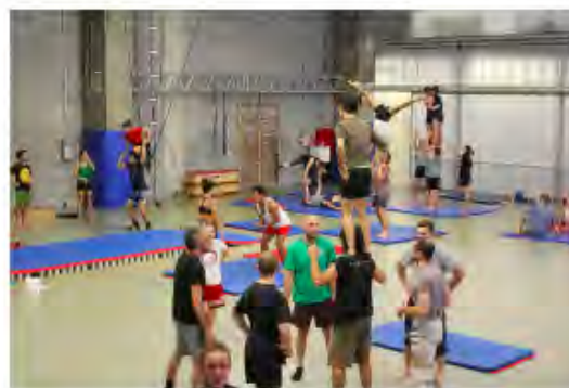
Trobada Ma a Ma Octubre 201