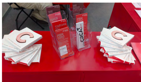
Detall Estand Fira Tàrrrega 2018

Des de fa anys, l'Associació assisteix a fires i festivals de circ i arts escèniques, de forma presencial amb materials de difusió i, puntualment, també amb estand propi. Aquest any 2018 hem estat presents a FiraTàrrrega, la Fira de Circ de Catalunya Trapezi Reus i la Fira d'Arrel Tradicional Mediterrània: També hem estat presents a la Mostra d'Igualada, la Fira de la Bisbal, el Congreso CircoRed a Madrid i el Festival Cau a Granada, i una delegació ha visitat Chalons a França per començar a xerrar de la possible gran acció d'internacionalització de l'any 2021.