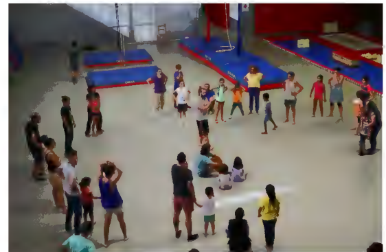
Circ en Família Octubre 2018