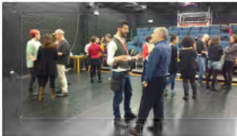
Jornada Enllaç a la Caldera

Parc del Fòrum de Barcelona Moll de la Vela, 2 08930 Sant Adrià del Besòs (Barcelona) Telf. (+34) 93 356 09 31 info@apcc.cat www.apcc.cat