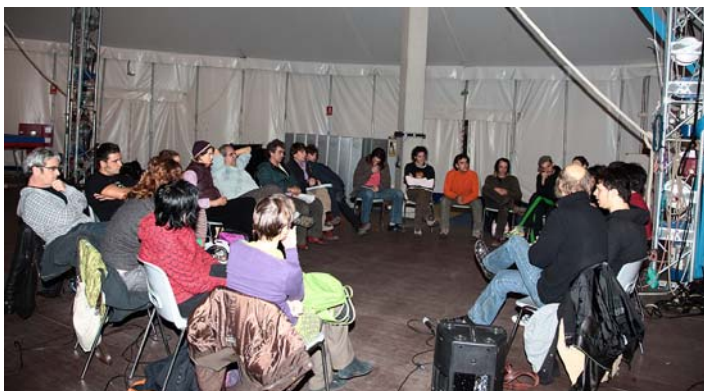
La direcció escènica en els espectacles de circ