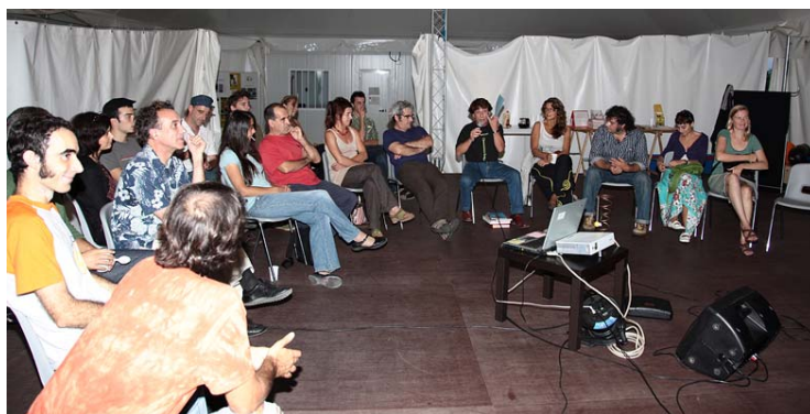
"Els inicis del nou circ a Catalunya"

Les tertúlies han estat un espai de debat, formació i anècdotes, obert a tothom, que continuarà l'any vinent amb noves propostes.