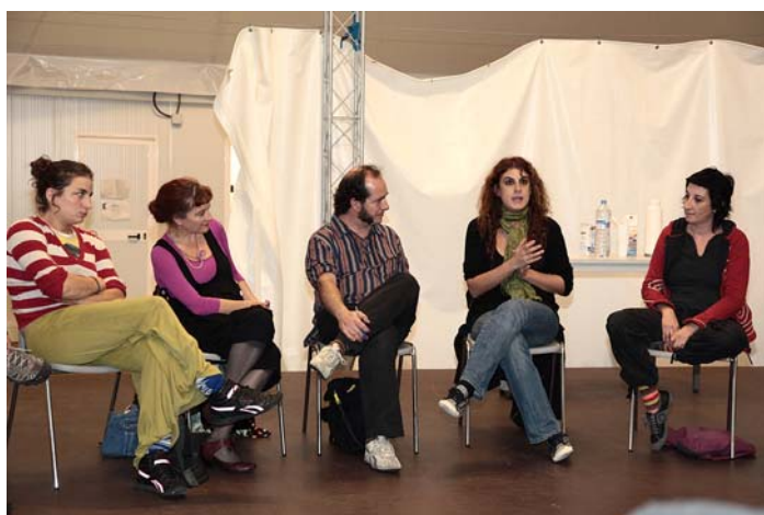
Pallasses, una espècie en vies d'expansió