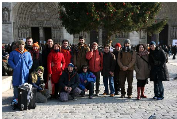
El grup, gairebé al complet, davant Notre-Dame

L'APCC ha organitzat una sortida al 30è Festival Cirque du Demain i a l' Academie de Cirque Fratellini de París (França) el mes de gener. A l'activitat van participar 19 persones entre socis i amics i amigues del circ.