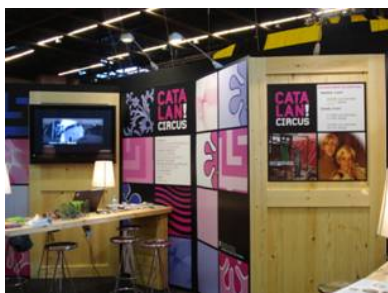
Saló Mundial de Circ de París