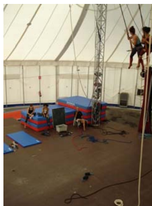
Imatges del curs de trapezi de balanç amb Fill de Block